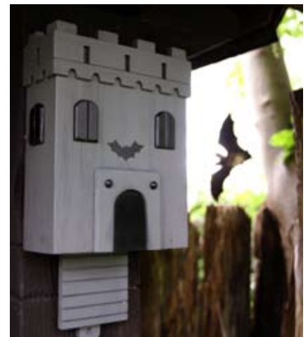
Fledermausburg Art.-Nr.: WG306