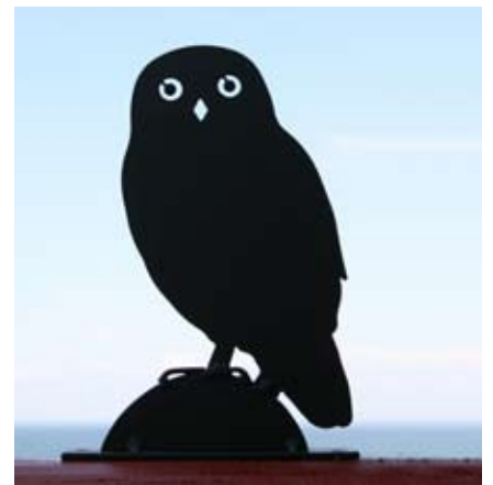
Kleine Eule Art.-Nr.: WG706

Charakteristische Silhouetten bekannter Vögel als Gartendekoration in Originalgröße. Die schwarzen Silhouetten stehen auf einer stabilen Eisenplatte mit zwei diagonal angeordneten Löchern für Schrauben. So können sie beispielsweise an einem Zaun, am Dach oder an einem Balkongeländer angebracht werden. Das verwendete Material, Eisen, ist mit einem schwarzen, rostbeständigen Schutzlack versehen und somit hervorragend für den Außenbereich geeignet.