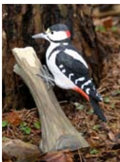
DecoBird Buntspecht Art.-Nr.: WG451