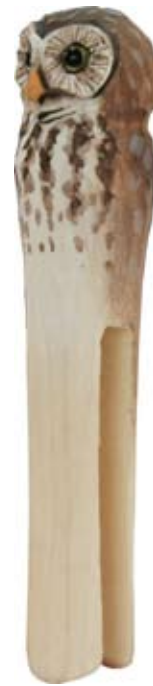
DecoClip Eule Art.-Nr.: WG555