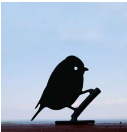
Blaumeise Art.-Nr.: WG704