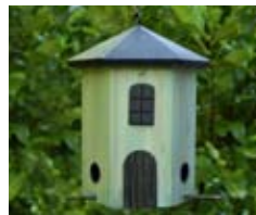
Grün Art.-Nr.: WG243