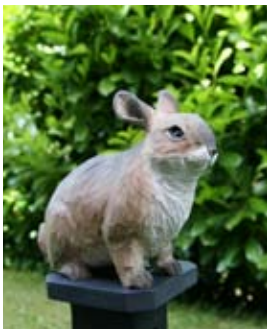
Kaninchen Art.-Nr.: WG471 Höhe: ca. 14 cm