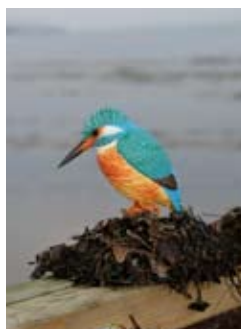
DecoBird Eisvogel Art.-Nr.: WG454