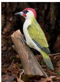
DecoBird Grünspecht Art.-Nr.: WG452