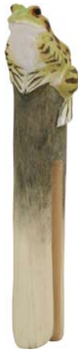
DecoClip Frosch Art.-Nr.: WG554