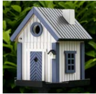
Seeschuppen Art.-Nr.: WG203