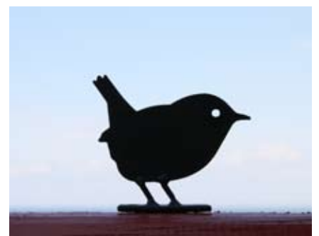
Zaunkönig Art.-Nr.: WG703