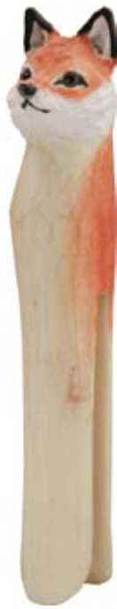
DecoClip Fuchs Art.-Nr.: WG553