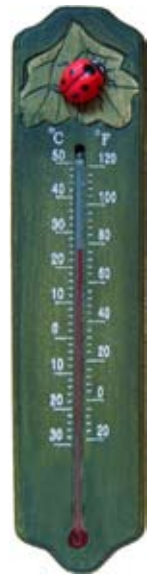
Thermometer Marienkäfer Art.-Nr.: WG564