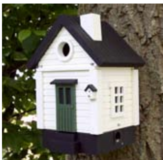
Modern Cottage weiß Art.-Nr.: WG214