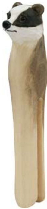
DecoClip Dachs Art.-Nr.: WG552