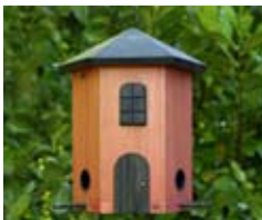
Rostrot Art.-Nr.: WG241