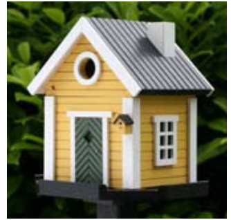
Villa Art.-Nr.: WG204