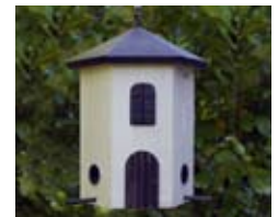
Weiß Art.-Nr.: WG245