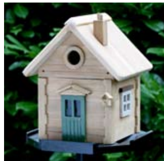
Landhaus Art.-Nr.: WG210