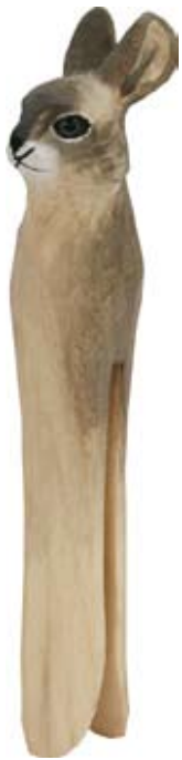
DecoClip Kaninchen Art.-Nr.: WG551