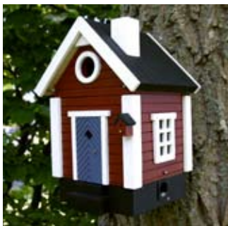
Modern Cottage rot Art.-Nr.: WG213