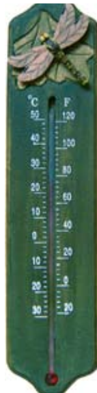
Thermometer Libelle Art.-Nr.: WG563