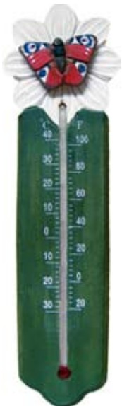
Thermometer Schmetterling Art.-Nr.: WG561

Handgeschnitzt aus Lindenholz, mit umweltfreundlichen, wasserabweisenden Farben hübsch bemalt. Geeignet für drinnen und draußen. Temperaturskala in Grad Celsius und Fahrenheit.