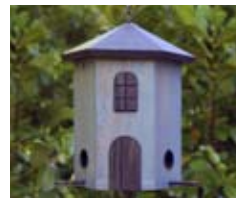
Blau Art.-Nr.: WG244