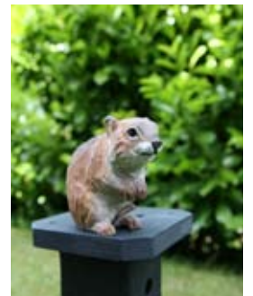
Wühlmaus Art.-Nr.: WG474 Höhe: ca. 6 cm

DecoAnimal ist eine Serie hübscher handgeschnittener Tiere aus Lindenholz, die ausschließlich mit umweltfreundlichen Farben naturgetreu bemalt werden. Bei den vorerst vier DecoAnimals, die in Originalgröße hergestellt werden, handelt es sich um Nachbildungen in Europa vorkommender Tiere, die wir aus Feld und Flur kennen: Kaninchen, Eichhörnchen, Igel und Wühlmaus. Ein schöner Platz für sie findet sich bestimmt im Gewächshaus oder zwischen Blumen und Pflanzen im Wintergarten.