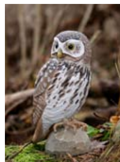
DecoBird Eule Art.-Nr.: WG455