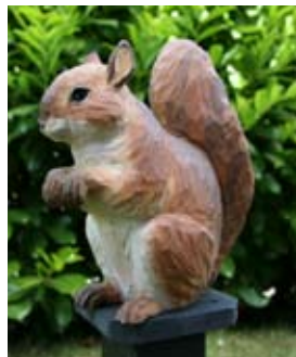
Eichhörnchen Art.-Nr.: WG472 Höhe: ca. 17 cm