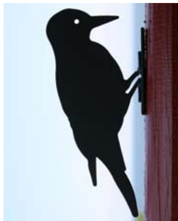
Buntspecht Art.-Nr.: WG705