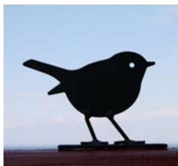
Rotkehlchen Art.-Nr.: WG702