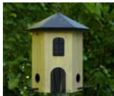
Gelb Art.-Nr.: WG242