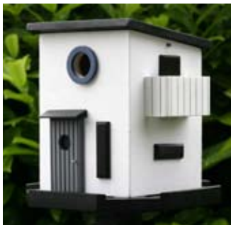
Bauhaus Art.-Nr.: WG208