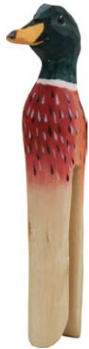
DecoClip Ente Art.-Nr.: WG556