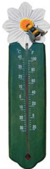
Thermometer Hummel Art.-Nr.: WG562