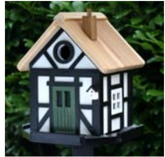
Tudor-Haus Art.-Nr.: WG211