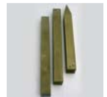
Montagepfahl Art.-Nr.: WG901

Material: Kiefernholz Gewicht: 1,8 kg Maße: 3 x 0,60 m lang, 4,5 x 4,5 cm Kantenlänge; zusammengebaut max. 1,80 m hoch