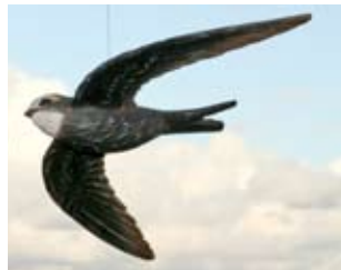
Mauersegler Art.-Nr.: WG422