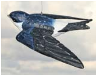
Mehlschwalbe Art.-Nr.: WG421