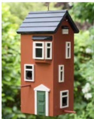
Stadthaus terracotta Art.-Nr.: WG231