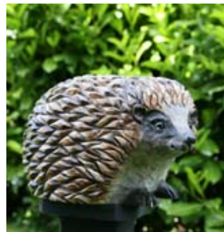
Igel Art.-Nr.: WG473 Höhe: ca. 10 cm