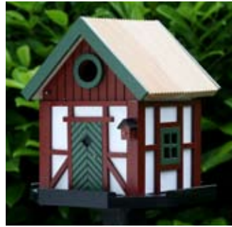
Schonenhaus Art.-Nr.: WG202