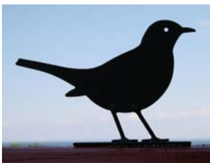
Amsel Art.-Nr.: WG701