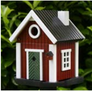
Schwedenkate Art.-Nr.: WG201