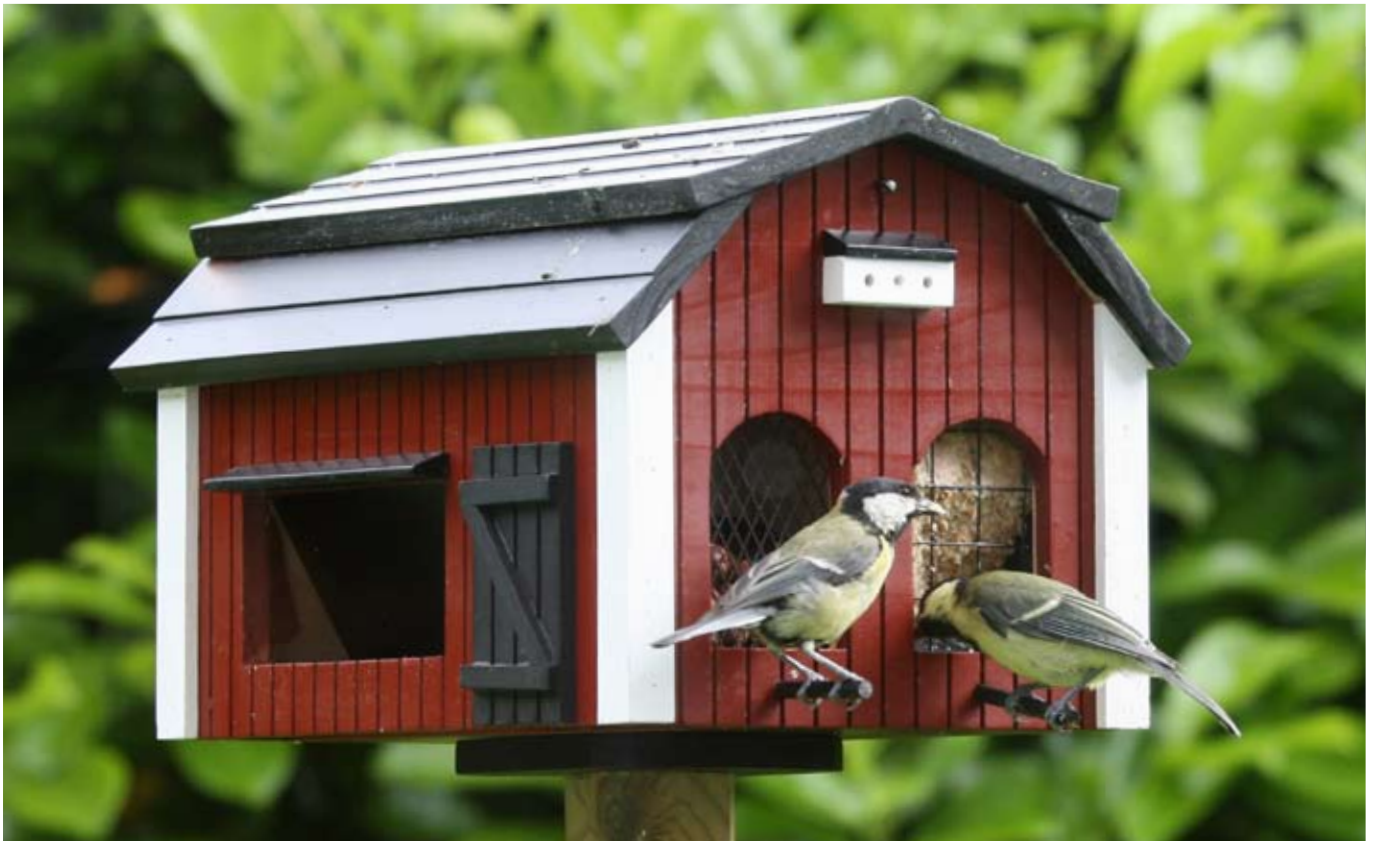
Futterscheune rot Art.-Nr.: WG221