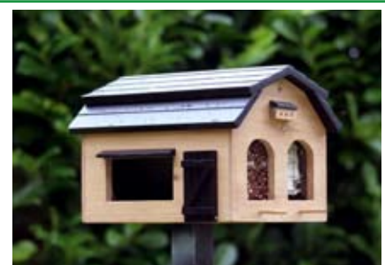
Futterscheune natur Art.-Nr.: WG222

Futterfenster: 4 für unterschiedliche Futterarten. Ermöglicht das Auslegen von Insektenkuchen, Talg- und Meisenknödeln, Erdnüssen sowie unterschiedlichen Körnermischungen. Verpackung: Geschlossener Karton; Montageanleitung (deutsch, englisch, schwedisch)