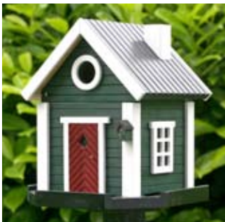
Jagdhaus Art.-Nr.: WG207